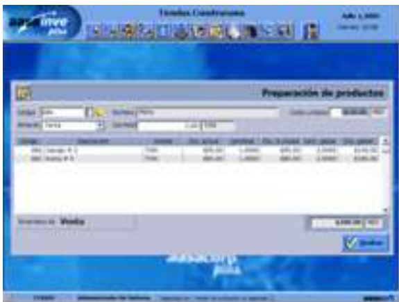
Preparación de Productos