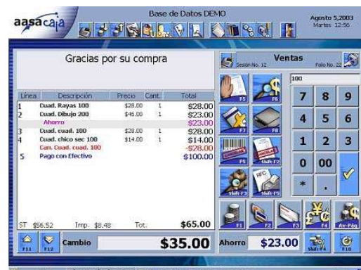
Ventas - caja registradora