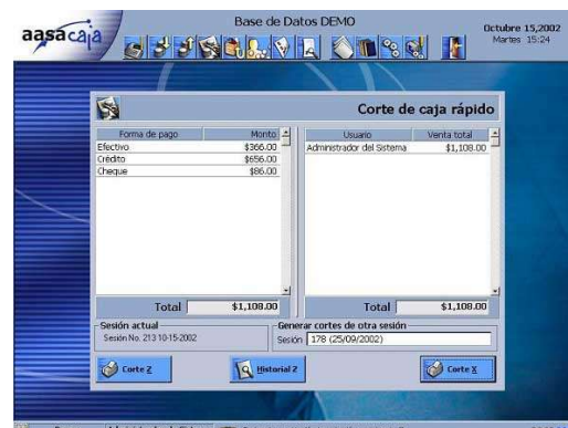
Corte de caja rápido